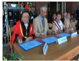
Wildeshausen feiert Städtepartnerschaften